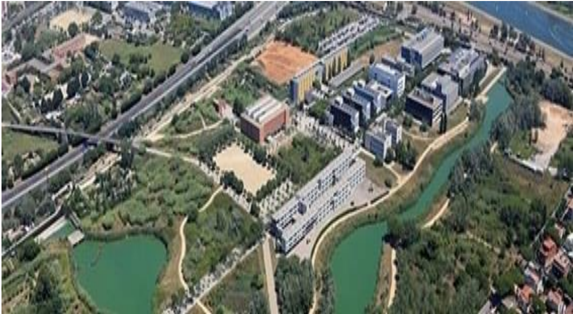
Campus de la Universitat Politècnica de Catalunya del Baix Llobregat, Castelldefels, Barcelona ( https://cbl.upc.edu/ca ).

El Campus del Baix Llobregat se encuentra en el municipio de Castelldefels (a 5 minutos andando de su centro neurálgico).