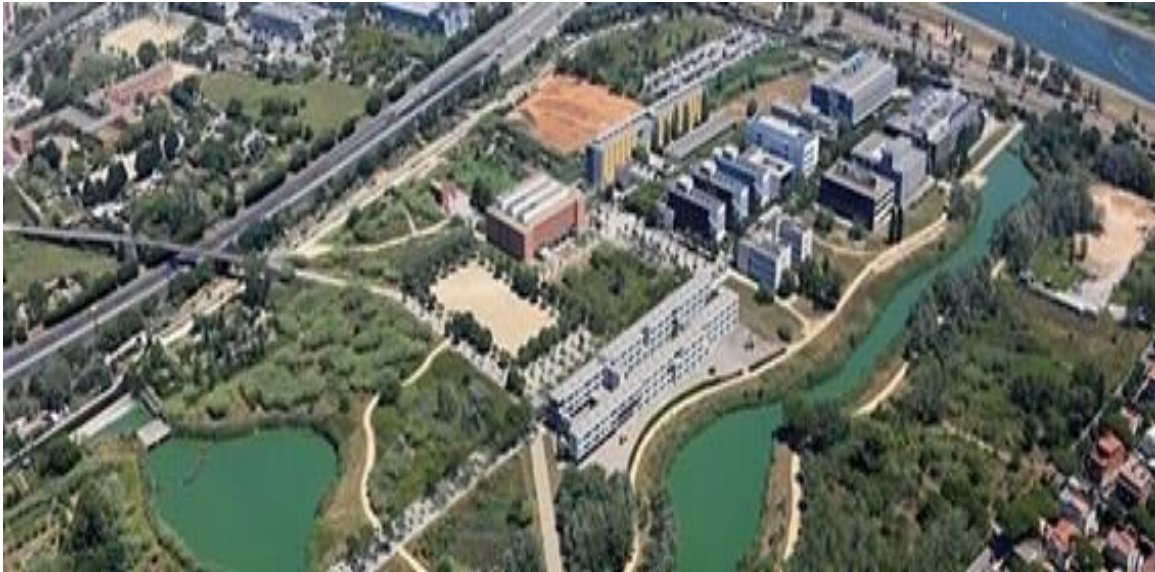
Campus de la Universitat Politècnica de Catalunya del Baix Llobregat, Castelldefels, Barcelona ( https://cbl.upc.edu/ca ).

El Campus del Baix Llobregat se encuentra en el municipio de Castelldefels (a 5 minutos andando de su centro neurálgico).